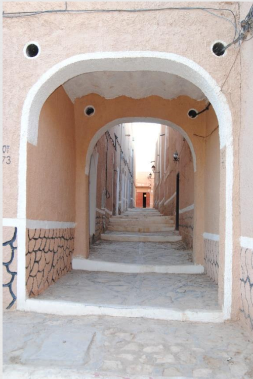
Ruelle étroite entrecoupé couverte par endroit