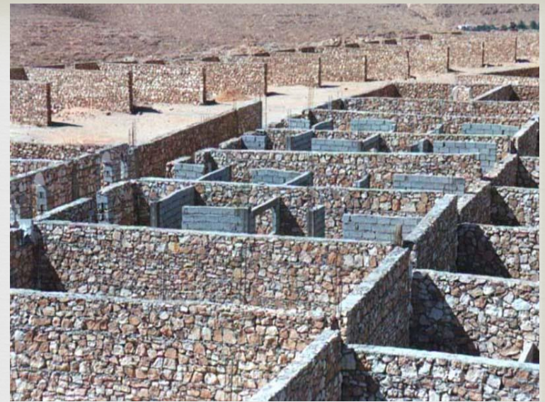
Super structure en pierre