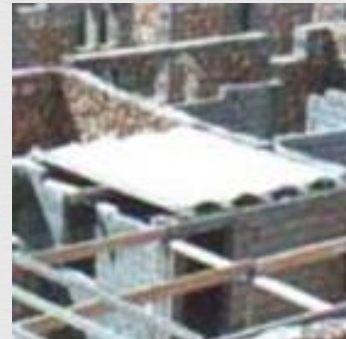
Plancher en voutain de plâtre