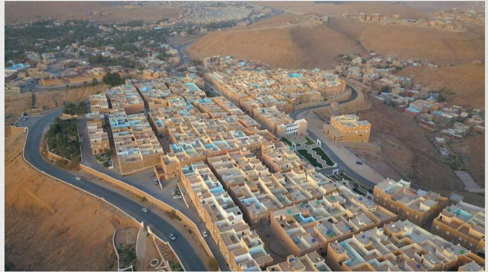
Tissu urbain compact