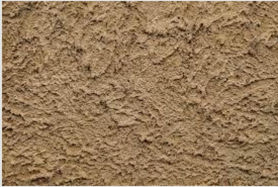
Crépissage façade en mortier de chaux