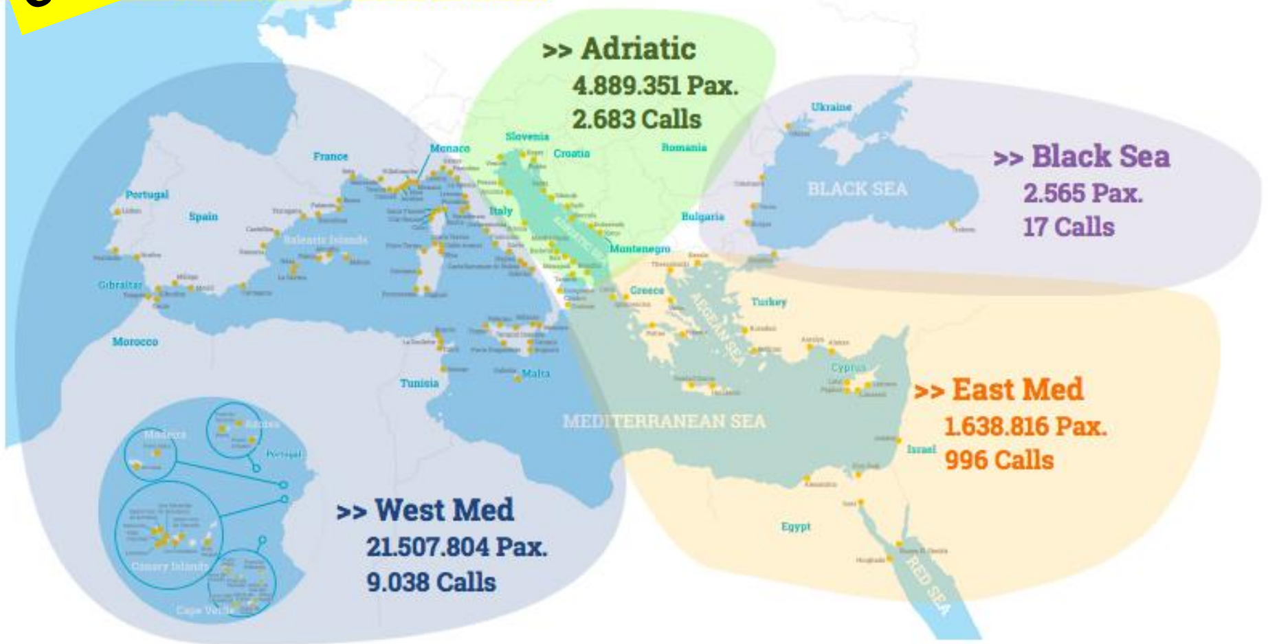
Cruise Traffic by MedCruise Region in 2018